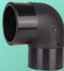
زانو جوشی ۹۰