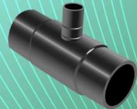
سه راه تبدیل جوشی