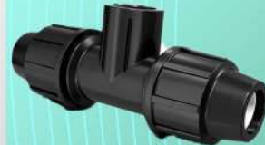
سه راه ماده