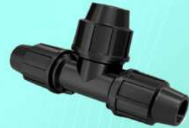
سه راه ساده