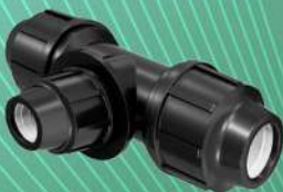
سه راه تبدیلی