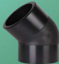
زانو جوشی ۴۵