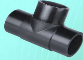
سه راه جوشی