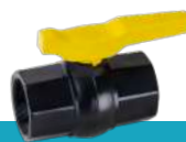
شیر توپی تک ضرب دسته پلیمری