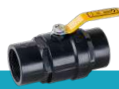
شیر توپی دو ضرب دسته فلزی با توپی آبکاری