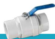
شیر توپی پرو وایت دسته فلزی با توپی بدون آبکاری