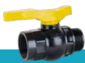
شیر توپی تک ضرب دسته پلیمری یک سر نر یک سر ماده