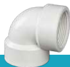
زانو ماده رزوه‌ای U-PVC