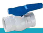
شیر توپی پرو وایت دسته پلیمری