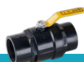
شیر توپی دو ضرب دسته فلزی با توپی بدون آبکاری