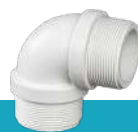
زانو نر رزوه‌ای U-PVC