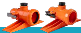
کد گروه محصول: ۴۳۱۷۳